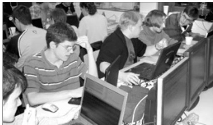
Die Mannschaft der TU Wien war am kreativsten.

schule Aachen geschlagen geben. Der dritte Rang ging an die TU Darmstadt. Die höher eingeschätzten amerikanischen Universitäten belegten die Plätze vier, sieben und neun. Ziel des seit 2003 ausgetragenen Räuber-und-Gendarm-Spiels im Internet ist es, realen Attacken über das Internet vorzubeugen. ■