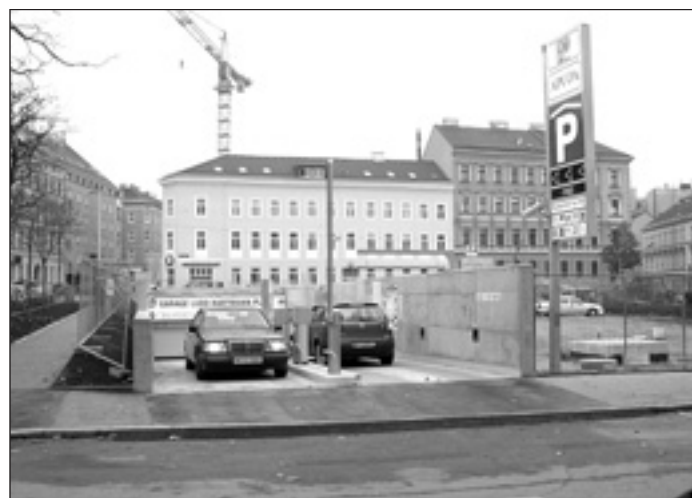
Volksgarage Ludo-Hartmann-Park in Ottakring.

Im 5. Bezirk rufen Garagengegner unterdessen zur Demonstration gegen den bevorstehenden Baubeginn im Bacherpark auf. Beginn: kommenden Montag ab 16 Uhr vor dem Amtshaus Margareten. ■